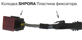
Рис. 2. Внешний вид SHPORA с выносной колодкой.